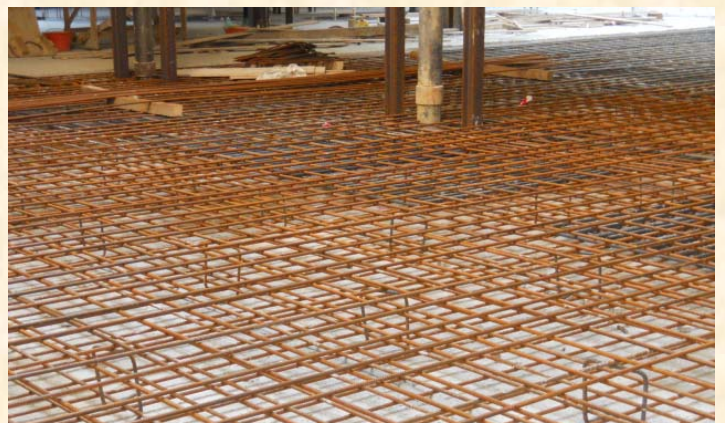
Plan de depósito, armadura en acero de la plataforma del fondo (julio 2014)