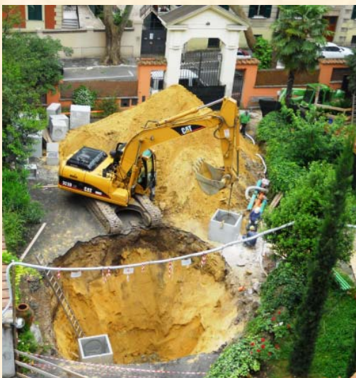
Cortil de acceso a la Facultad, excavación para las descargas del desagüe y aguas pluviales (mayo de 2014)