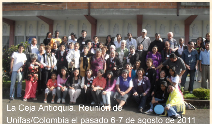
La Ceja Antioquia. Reunión de Unifas/Colombia el pasado 6-7 de agosto de 2011