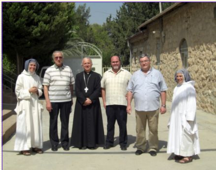
Foto: Mons. William Shomali entre los frailes OSM y las contemplativas actualmente residentes en Deir Rafat